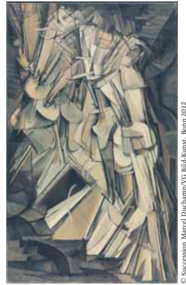
Marcel Duchamp, Akt eine Treppe herabsteigend Nr. 2, 1912 , Philadelphia Museum of Art; The Louise and Walter Arensberg Collection, 1950

Wer schon immer mal einen Akt eine Treppe herabsteigend sehen wollte, der kann ganz bequem die Rolltreppe in den Kunstbau am Königsplatz herunterfahren. Dort finden sich alle Werke von Marcel Duchamp, die er vor 100 Jahren in München geschaffen hat. Wer die Gelegenheit verpasst, muss eine Reise nach Philadelphia, New York, Houston, Paris, London, Haimhausen und Schwerin auf sich nehmen. mm