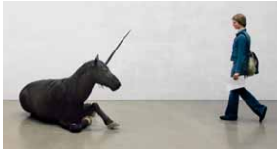
Einen Besuch wert: Olaf Nicolais La Lotta , 2006, Fell, Horn, Polyester, elektrische Heizung, Objekttemperatur 43,2°C