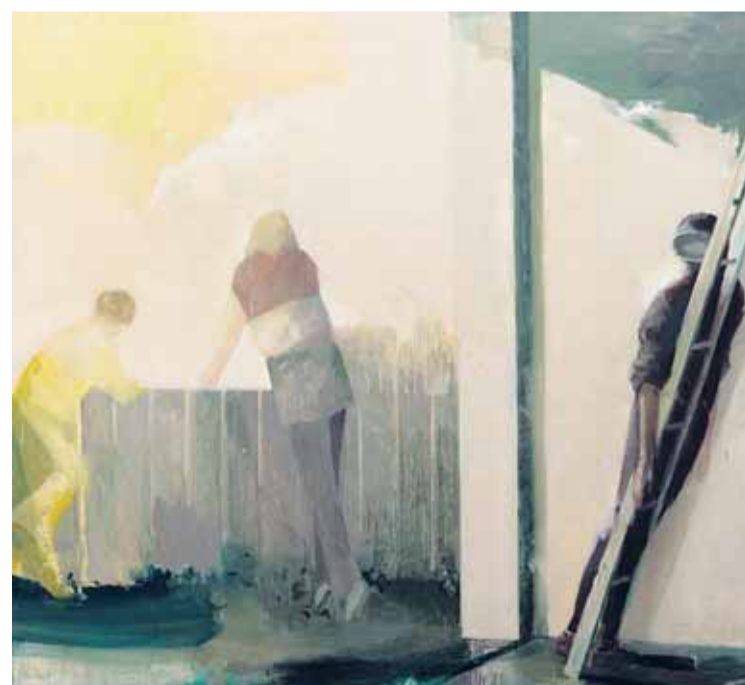
Uta Reinhardt, Schwelle, 2012

Internationale Sommerakademie für Bildende Kunst Salzburg www.summerakademie.at