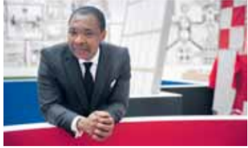
Okwui Enwezor in der Ausstellung Matt Mullican , Haus der Kunst, 2011

Sein warmes, dunkles Lachen hält schon von weitem durch die langen Gänge des Haus der Kunst. Als er dann durch die schwere Eichentür tritt und zur Begrüßung die Hände schüttelt, füllt er den ganzen Raum mit seiner charismatischen Präsenz.