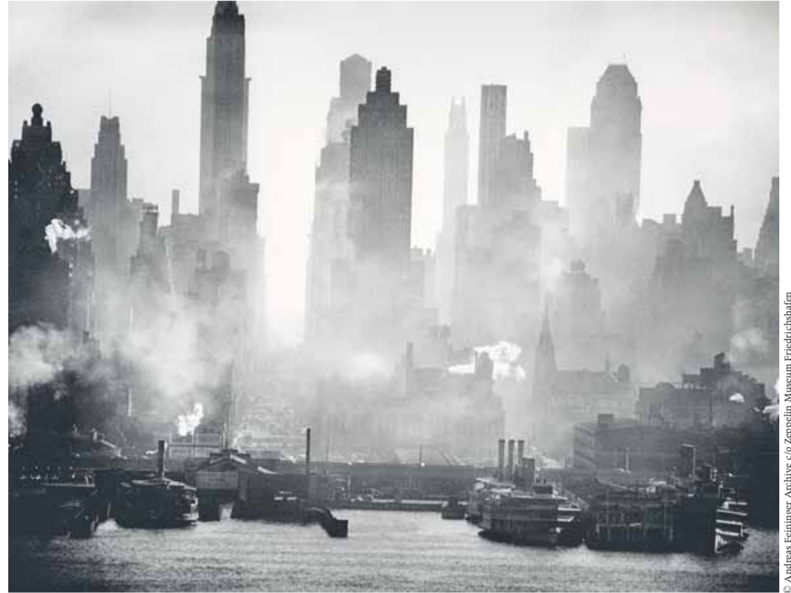
Andreas Feininger, 42nd Street View , 1942, Münchner Stadtmuseum, Sammlung Fotografie