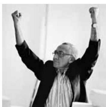
Gerhard Richter, 1993

faszinierten: Mörder und ihre Opfer, Flüchtlinge, Landschaften aus der Ferne, Tiere, Autos. Unzählige Bilder schnitt er aus, bündelte sie zu seinem persönlichen „Atlas“ und bediente sich der Vorlagen. Er isolierte einzelne Bildausschnitte, übertrug sie auf die Leinwand und überarbeitete so lange die Oberflächen mit Farbe, bis er die typisch verschwommene Optik seiner Gemälde erzielte. Wozu diese Verfremdung? „Eine gute Methode, dieses Verwischen, um etwas anscheinlich zu machen“, erklärte er seine Motivation.