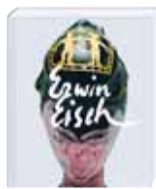
Hirmer Verlag € 49,90

Erwin Eisch Hrsg. von Ines Kohl, Katharina Eisch-Angus, Karin Schrott