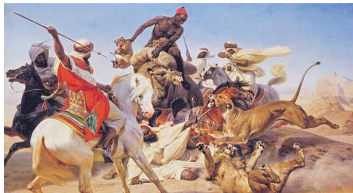
Detail aus: Horace Vernet, Die Löwenjagd , 1836, London, The Wallace Collection

Katalogbuch zur Ausstellung im Belvedere, Wien Vom 29. 6. – 14. 10. 2012