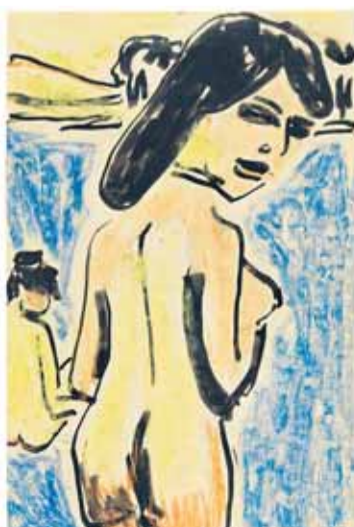
Ernst Ludwig Kirchner, Badende an den Moritzburger Teichen , 1909, Brücke-Museum Berlin