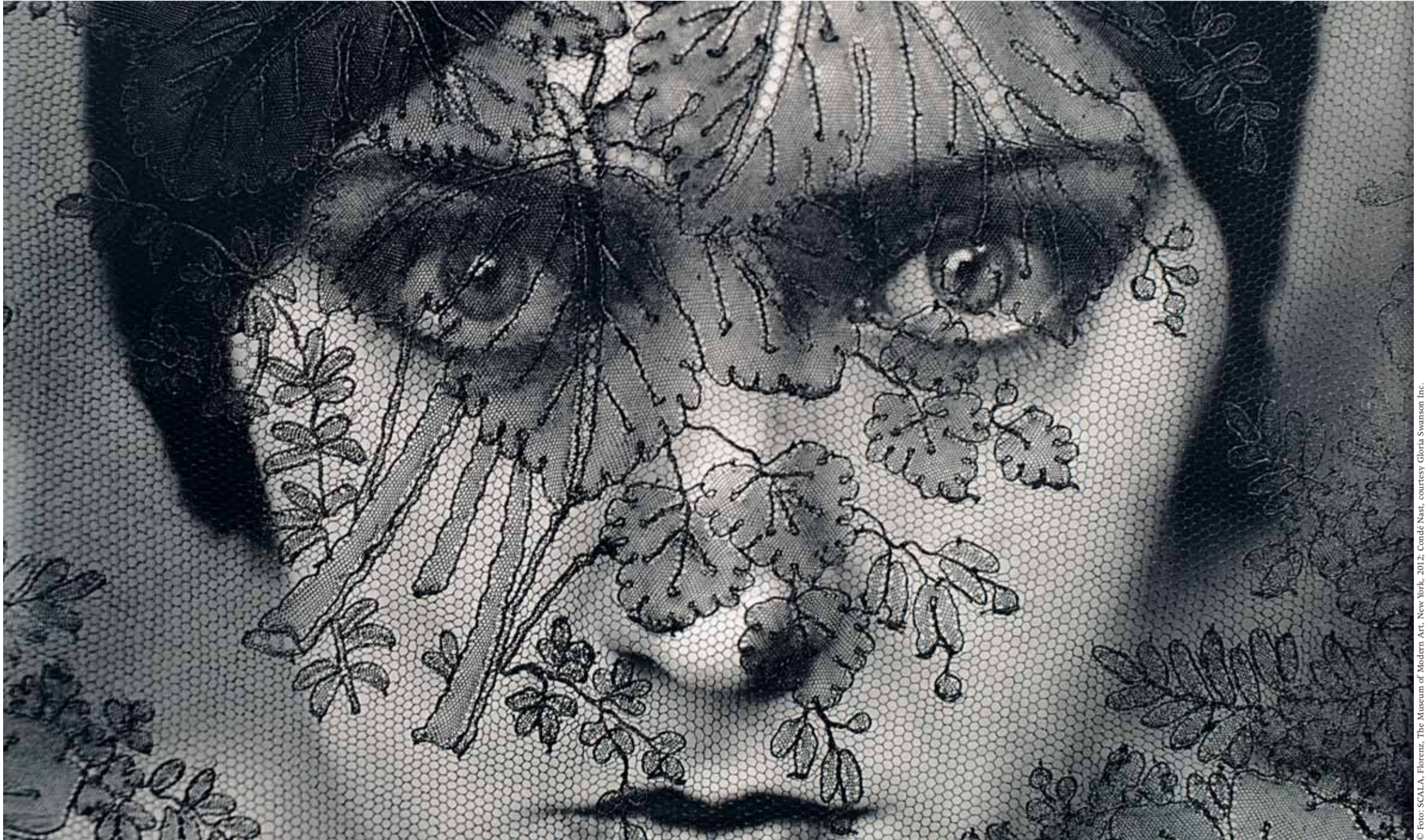
Ausschnitt aus: Edward Steichen, Detail aus Gloria Swanson , 1924, The Museum of Modern Art, New York Zur Ausstellung und Publikation New York Photography 1890–1950. Von Stieglitz bis Man Ray (Seite 2)

Mit Lesetipps von unseren Profis auf Seite 5