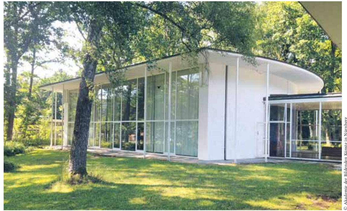
Sep Ruf entwarf die 1954 erbauten Pavillons der Akademie für den bewaldeten Campus am östlichen Stadtrand Nürnberg