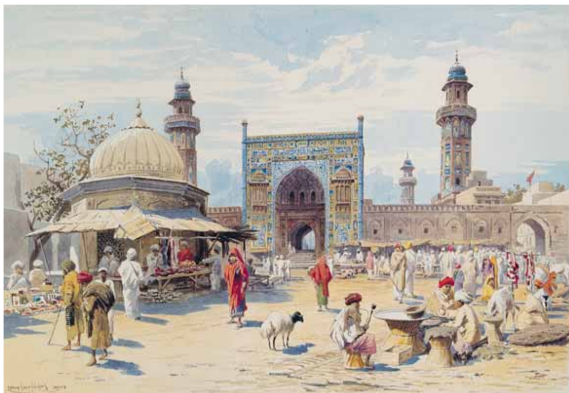
Ludwig Hans Fischer, Basar in Lahore , 1888/89, Graphische Sammlung am Kunsthistorischen Institut, Tübingen

Eine gehörige Portion Abenteuerlust mussten die Künstler Mitte des 19. Jahrhunderts schon mitbringen, um Länder wie Ägypten, Palästina, Syrien oder Kleinasien zu bereisen. Berichte über Forscher und Kaufleute, die jahrelang in der Sklaverei verbringen mussten, bevor ihnen – wenn überhaupt – die Flucht gelang, waren keine Seltenheit. Aber diejenigen, die das Abenteuer unbeschadet überstanden hatten und in die Heimat zurückkehrten, weckten mit ihren Schilderungen vor allem bei Künstlern die Neugier auf das Reisen in exotische Länder. Neue Motive wie