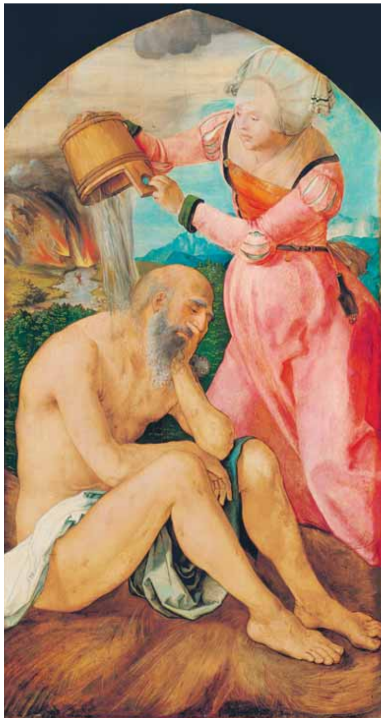
Albrecht Dürer, Hiob auf dem Misthaufen , linker Außenflügel des so genannten Jabach-Altars, um 1503/1505. Frankfurt am Main, Stadel Museum, Nr. 890

5. Juli bis 16. September 2012 Dokumentationszentrum Reichsparteitagsgelände Informationen: www.adbk350.de