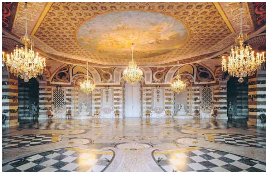
Neues Palais von Sanssouci, Grottensaal

Mit der Wahl des Ausstellungstitels Friederisiko hat das Ausstellungsteam um Hartmut Dorgerloh, Reinhard Alings und Jürgen Luh Stellung bezogen und das Gefährliche, Aggressive und Doppelgesichtige des Preußenkönigs treffend umschrieben. Der Monarch machte gern ein Geheimnis um seinen wahren Charakter, seine Moral und seine Absichten. Doch alles sollte seinem Ruhm dienlich sein, der, so dachte er, am besten durch siegreiche Schlachten zu erlangen sei – auch die 180.000 preussischen Soldaten, die im siebenjährigen Krieg ihr Leben ließen.