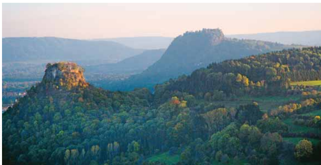
Blick auf die Hegauberge mit Hohenkrähen und Festung Hohentwiel